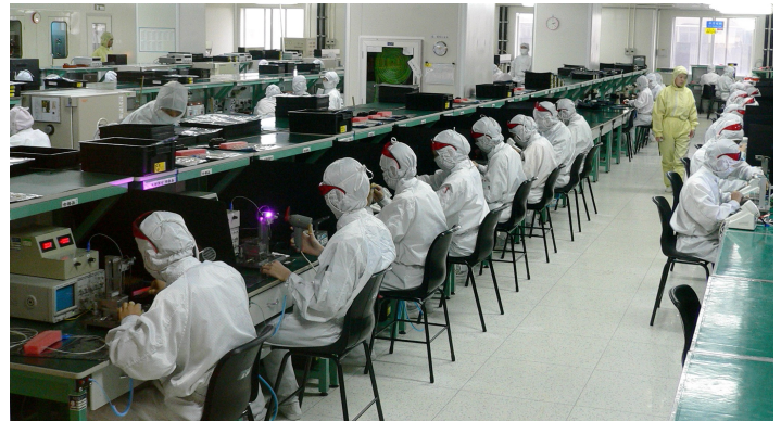
L'usine Foxconn à Longhua, en Chine

C'est là, au cœur de la Silicon Valley, que sont élaborés les ipods ( designed in California ) par une main-d'oeuvre très qualifiée.