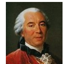
Buffon (1707 - 1788)