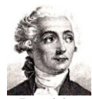
Lavoisier (1743 - 1794) savant philosophe économiste