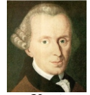
Kant (1724 - 1804) Philosophe