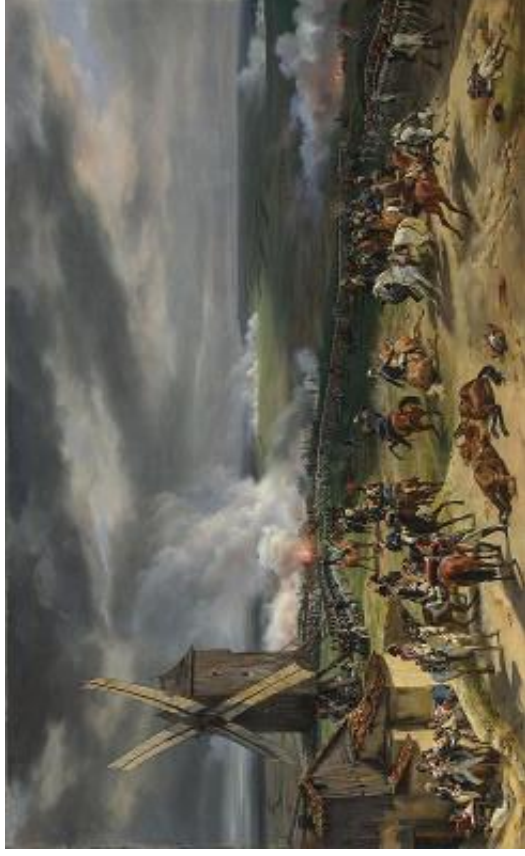
Doc. 2: La bataille de Valmy, le 20 septembre 1792, peinture d'Horace Vernet, 1826.